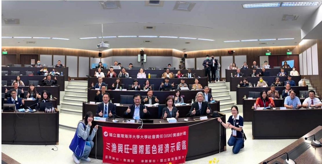
「112 年共同培力系列活動-USR 國際合作經驗與願景 讓世界看見臺灣」11 月 24 日於海大舉辦(大合照全景)